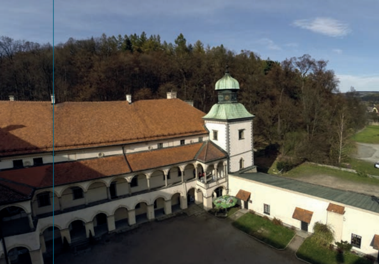
Skrzydło zachodnie renesansowego zamku z charakterystyczną wieżą zegarową i fragment skrzydła parterowego.

S ucha Beskidzka, pomimo tego że jest miastem stosunkowo niewielkim, posiada interesującą i różnorodną architekturę. Można tu obejrzeć zarówno przykłady rezydencjonalnego założenia zamkowego, zabytkowy zespół kościelno-klasztorny składający się z odmiennych stylistycznie budowli kościołów z XVII-XX wieku, nieliczne już przykłady małomiasteczkowego budownictwa mieszkalnego (murowanego i drewnianego), interesujące obiekty użyteczności publicznej z różnych okresów, ciekawe obiekty małej architektury (zwłaszcza sakralnej), a także – w osiedlach oddalonych od centrum, rozrzuconych na stokach okolicznych wzniesień i w dolinach spływających z nich potoków – przykłady zanikającej starej zabudowy drewnianej.