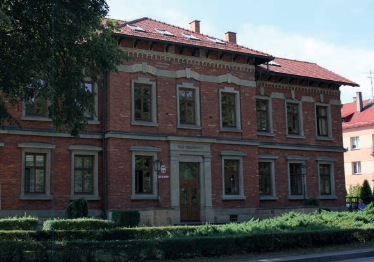
Budynek Sądu. Fot. Monika Spyрка

i gospodarczym okolicy, a od 1896 roku posiadającej formalne prawa miejskie, zachowało się do dzisiaj kilka interesujących budowli użyteczności publicznej , a także będących na przestrzeni lat siedzibą władz administracyjnych i sądowniczych. Wyróżniają się wśród nich dwa podobne stylistycznie, ceglano-brytowe gmachy, o historyzujących, symetrycznych fasadach: budynek przy ul. Mickiewicza 11, wzniesiony w 1905 roku jako siedziba c.k. Sądu Powiatowego i Urzędu Podatkowego (do dzisiaj jest to siedziba Sądu Rejonowego) oraz trzy lata starszy gmach dawnego Magistratu przy ul. Piłsudskiego 23 (obecnie mieszczą się w nim: Biblioteka Suska oraz Prokuratura Rejonowa).