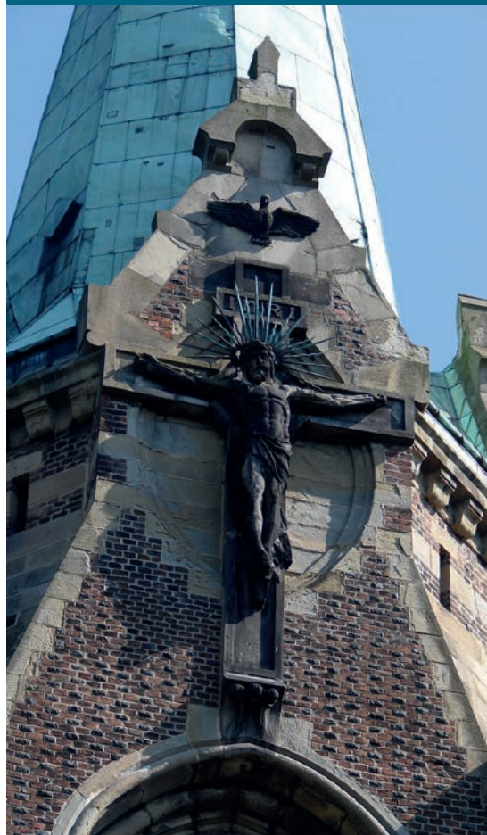
Kamienna figura Chrystusa na wieży kościoła pod wezwaniem Nawiedzenia Najświętszej Marii Panny w Suchej Beskidzkiej (XIX/XX w.).