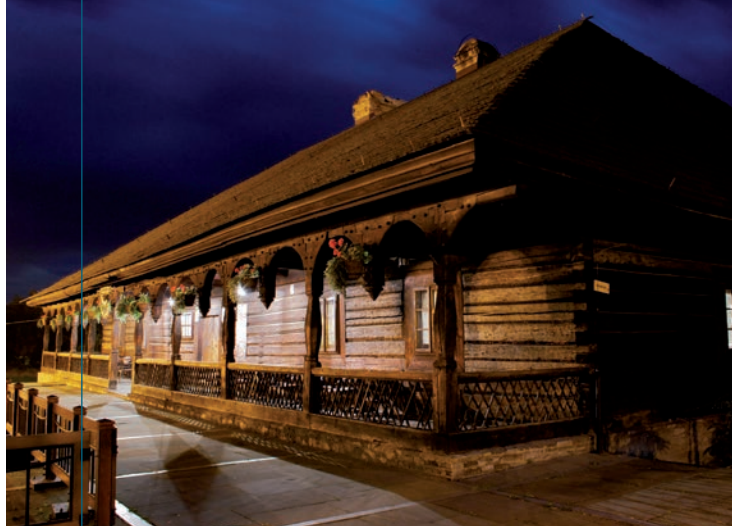
Karczma „Rzym”.

N ajcenniejszym obiektem Rynku jest stojąca w jego wschodniej części drewniana karczma „Rzym”. Ta piękna budowla zrębowa z potężnym dachem czterospadowym, krytym gontem, jest od strony placu zdobiona arkadowymi podcie-