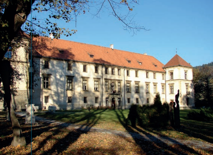
Widok na południową elewację zamku.

drzwi tej części rezydencji posiadają renesansowe profile. Wieża północno-wschodnia zwieńczona jest żelazną chorągiewką z logiem zamku wawelskiego i datą „1974” (wówczas Państwowe Zbiory Sztuki na Wawelu przejęły zamek i były jego zarządcą do 1995 roku, kiedy pieczę nad zabytkowym zespołem objął samorząd miasta Sucha Beskidzka), a południowo-wschodnia – chorągiewką z herbem Korczak Branickich i datą „1905” upamiętniającą pożar zamku, który opanował w tym roku rezydencję i jej późniejszą odbudowę.