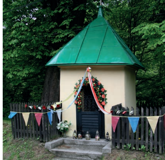
Kapliczka domkowa na Zasypnicy.

W śród pozostałych kapliczek do najciekawszych należy archaiczna kapliczka kolumnowa z 1743 roku na terenie os. Błądźonka, z wykutą na cokole Chustą Św. Weroniki i zwieńczona otwartą z trzech stron latarnią, w której umieszczona jest mała figurka Chrystusa Frasobliwego. Natomiast na płn. krańcach miasta, nieopodal granicy z Zembrzycami, na terenie posesji przy ul. Wadowickiej 6, stoi kapliczka z figurą św. Antoniego z 1728 roku. Tu także od frontu na cokole, znajduje się (słabo już widoczne) płaskorzeźbione przedstawienie Chusty Św. Weroniki. Ten motyw, podobnie jak datowanie kapliczki i rodzaj postumentu, na którym umieszczono figurę (kolumna toskańska), pozwalają domniemywać, że pierwotnie była to także kapliczka kolumnowa z latarnią, podobna do tej na Błądźonce.