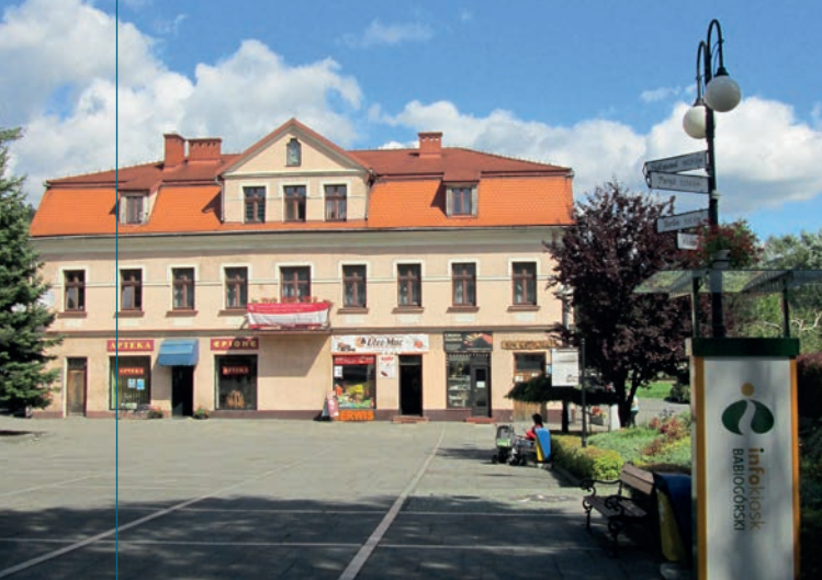
Dom Katolicki w Ryнку.

mów Ludowych, a dziś należący do tutejszej parafii. Drugim jest piętrowy budynek na rogu odchodzącej z Ryнку na wschód ul. Piłsudskiego, na którym zwracają uwagę secesyjne dekoracje oraz półkoliste, kute balkony. Inny obiekt, również posiadający oszczędne secesyjne zdobienia, to pochodzący z pocz. XX wieku dom przy ul. Piłsudskiego 51.