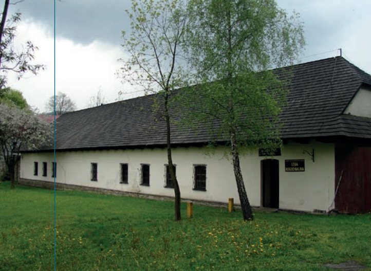
Budynek Domku Ogrodnika w parku zamkowym, w którym mieści się Dział Etnograficzny Muzeum Miejskiego.

wydużony, otynkowany na biało budynek, nakryty wysokim dachem siodłowym, krytym gontem. To tak zwany „Domek Ogrodnika”.