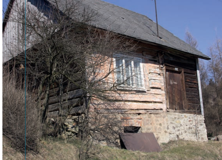
Chata wiejska na Kamiennym.

Jak jaskółcze gniazda uczone po szkarpach tutejszych groni i grap przedstawiają się domki gospodarzy, wśród pól zaś przykucnięte chatki wyglądają niby pigwy na zielonej szachownicy przekreślonej polnymi drogami i ścieżkami z postawionymi przy nich kapliczkami, zwane „świętkami”, rzeźbione w drzewie lub w kamieniu i prosto malowane. Większość tych domów ze ścianami nietynkowanymi od zewnątrz, ma szparki między belkami ściennymi fugowane i wybielone bielutkim wapnem, toteż domek taki otoczony sadem, z dalsza wygląda jak pisanka