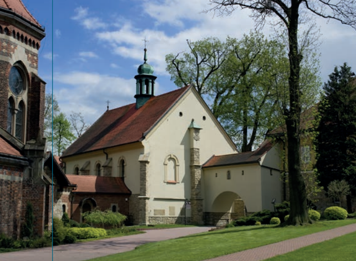
Siedemnastowieczny kościół NNMP wraz z arkadowym przejściem łączącym go z dawnym klasztorem-obecną plebanią.