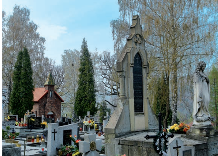
Cmentarz parafialny w Suchej. Nagrobek rodziny Gawlików.

Bardzo ciekawą grupę kapliczek słupowych można obejrzeć w zach. części miasta, przy ul. Role, po jej płd. stronie. Są to: kapliczka z figurą św. Antoniego z 1918 roku, bardzo ciekawa i oryginalna kapliczka z figurą Trójcy Świętej, prawdopodobnie z przełomu XVIII i XIX wieku, przykład ludowego baroku (figura przedstawia Trójcę Świętą w typie tzw. „Tronu Łaski” - głównym elementem kompozycji jest Bóg Ojciec w papieskiej tiarze na głowie podtrzymujący krzyż z przybitym doń Chrystusem, którego nogi przesłania z kolei otoczona aureolą Gołębicą - symbol Ducha Świętego), kapliczka z figurą św. Jana Chrzciciela z l. 60. XIX wieku oraz XIX-wieczna kapliczka z figurą Chrystusa Nazareńskiego, stojąca obok opisanego wyżej małomiasteczkowego domu nieopodal granicy Suchej Beskidzkiej i Stryśzawy (ul. Role 182). Inną kapliczkę z figurą Chrystusa Nazareńskiego (ufundowaną w 1869 roku) można obejrzeć przy ul. 3 Maja, a przy ul. Armii Krajowej oraz w rejonie siedliska Kasprzycówka - dwie kapliczki z figurami Matki Bożej z Dzieciątkiem (pierwszą wystawiono w 1893 roku, druga