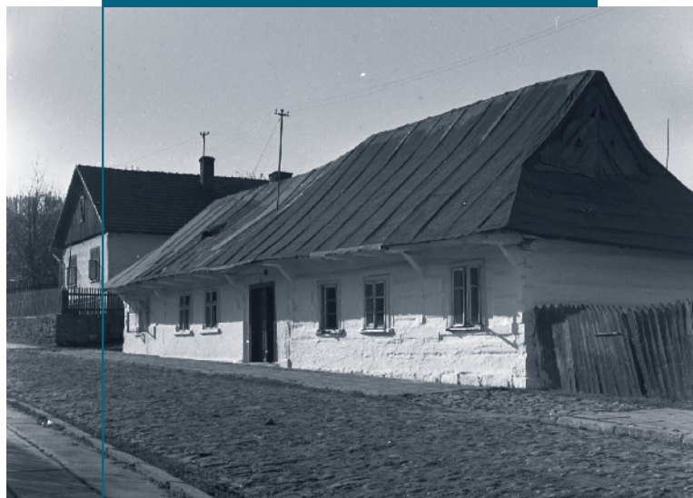
Dawna, tradycyjna zabudowa drewniana przy ul. Kościelnej.