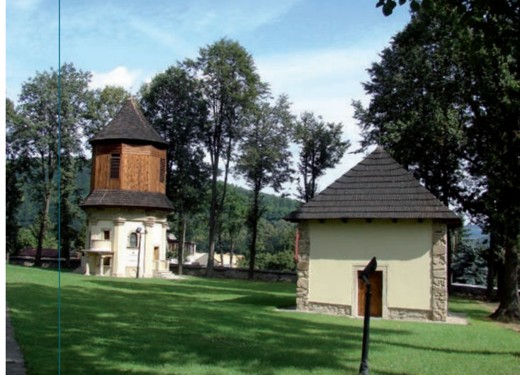
Kaplica-dzwonnica i kaplica Św. Huberta.

np. podwójnie dzielone okna – biforia, ale już np. strzelistość większości kościelnych okien czy wieży to elementy odwołujące się do gotyku.