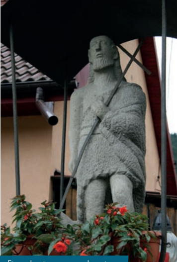
Figura kamienna z przedstawieniem Jana Chrzciciela na Rolach.