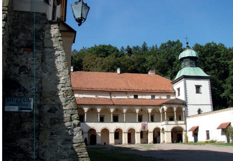
Widok zamku od strony dziedzińca.

C harakterystycznymi elementami flankującymi południową fasadę rezydencji od wschodu i zachodu są dwie dwupiętrowe wieże kryte dachami namiotowymi, wzniesione na początku XVIII wieku w ramach rozbudowy zamku przez Annę Konstancję z Lubomirskich Małachowską (z pierwszego małżeństwa – Wielopolską). Fakt ten upamiętnia kartusz z herbem Wielopolskich Starykoń i datą