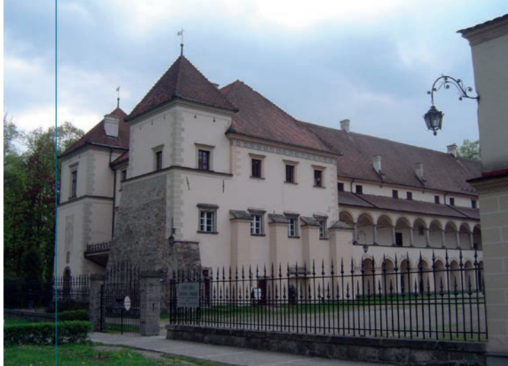
Południowo-wschodnie skrzydło zamku z przyporą kamienną.

Z amek w swoim obecnym kształcie jest budowlą trójskrzydłową, z czterema wieżami oraz prostokątnym niemiarowym dziedzińcem arkadowym, do którego wjazd prowadzi od wschodu (pierwotnie od wschodu dziedzińca ograniczał mur kurtynowy, w który wpisana była brama wjazdowa). Zamek niemal w całości został wzniesiony z kamienia łamanego, a następnie potynkowany. Pomimo zasadniczo późnorenesansowej bryły, jest obiektem niejednorodnym stylistycznie, a w dziejach jego budowy można wyróżnić trzy główne etapy, czytelne do dziś w architekturze całości: budowę dworu obronnego, wzniesionego przez Kaspę Suskiego w 2. poł. XVI wieku (niewykluczone, że na miejscu jakiegoś starszego założenia), renesansową rozbudowę zamku przez Piotra Komorow-