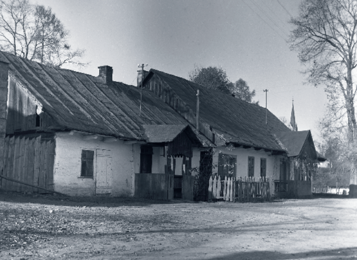
Dawna tradycyjna zabudowa przy ul. Podgórskiej – obecnie Piłsudskiego.

obraz tradycyjnej suskiej zagrody przedstawił A. Kawecki w pracy pt. „Podgórskie uzdrowisko Sucha”. Monografia, 1939 roku.