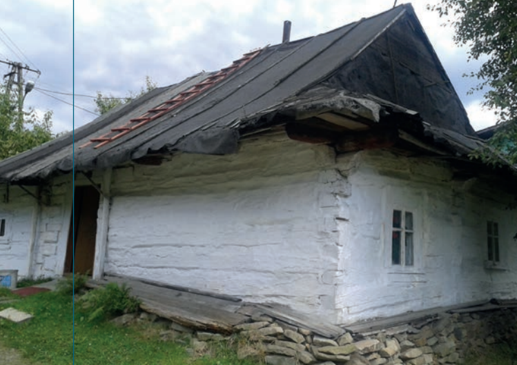
Dawny, tradycyjny dom na Smolikówce.

lotową sienią, półkoliście zamkniętym głównym wejściem z wrotami klepkowymi i mieczowaniami oraz facjatą z balkonikiem od frontu.