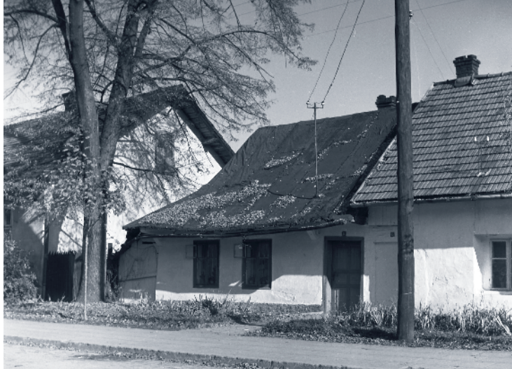
Dawna tradycyjna zabudowa przy ul. Kościelnej.

Kolejny etap stanowił budynek podzielony przelotową sienią, tzw. boiskiem na dwie części: gospodarczą i mieszkalną. Część mieszkalna składała się najczęściej z dymnej izby i tzw. komory, pełniące funkcję spiżarni, magazynu i składu narzędzi gospodarskich. W izbie główne miejsce zajmował dymny piec. Ogień palono na nalepie. Dym wydostał się przez otwór w powale na strych. Podłogę stanowiło klepisko z ubitej gliny. Tu koncentrowało się całe życie rodziny chłopskiej: wykonywano codzienne prace gospodarskie, przygotowywano posiłek itp. Nierzadko zimą przechowywano tu chronione przed zimnem zwierzęta, np. cielęta, a we wnęce pod piecem mieszkał drób i króliki. Kąt izby, gdzie znajdowało się łóżko gospodarzy, święte obrazy i stół często miał podłogę-pomost z desek i stanowił reprezentacyjny fragment pomieszczenia. Z tej jednoizbowej części mieszkalnej wykształciło się następnie wewnątrz podzielone na dwie odrębne izby – czarną czyli kuchnię i białą o odświętnym charakterze. Także i tu komora nadal pełniła funkcję magazynu i spiżarni.