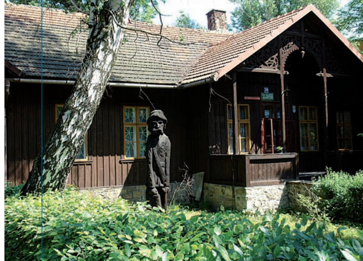
Drewniana willa dworska z 1875 roku.