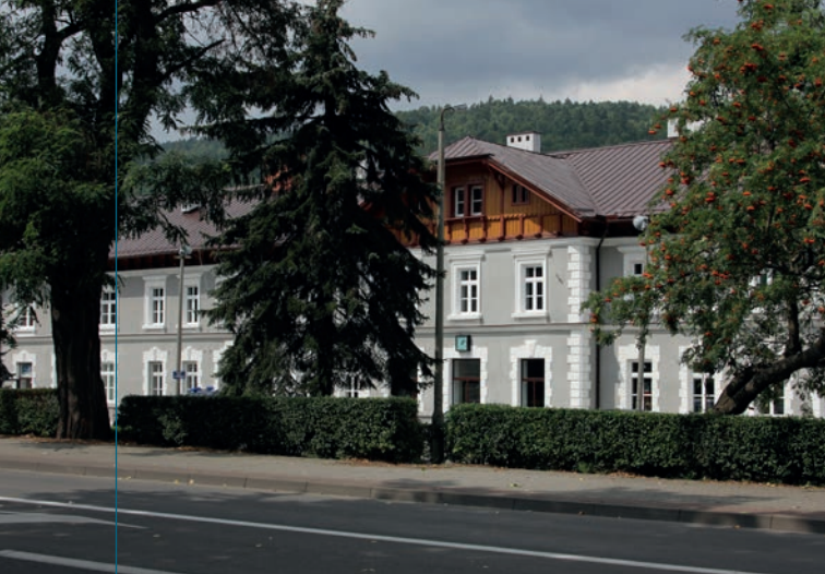
Budynek dworca kolejowego.

scowionym ryzalitem (uwagę zwracają dekoracyjne obramienia okien parteru), zaś od strony torów przejście przez peron przylegający bezpośrednio do budynku prowadzi pod pulpitowym daszkiem wspartym na żeliwnych kolumnkach.