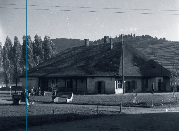
Karczma „Rzym”. Lata 50. te XX w.