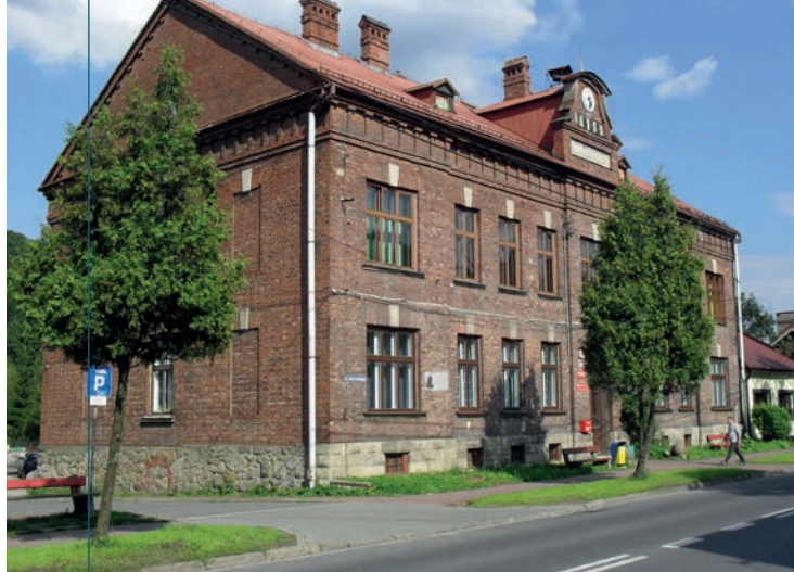
Budynek dawnego Magistratu.

Charakter murowanej willi małomiasteczkowej posiada także budynek z l. 70. XIX wieku będący niegdyś mieszkaniem urzędników suskiego dworu (m.in. zarządców pańskich lasów), a obecnie pozostający siedzibą Nadleśnictwa Sucha. Położony nieco na płn. od zamku (u. Zamkowa 7) jest