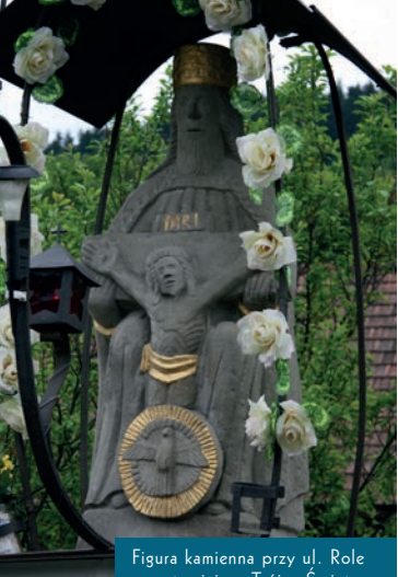
Figura kamienna przy ul. Role przedstawiająca Trójcę Świętą tzw. Tron Łaski.