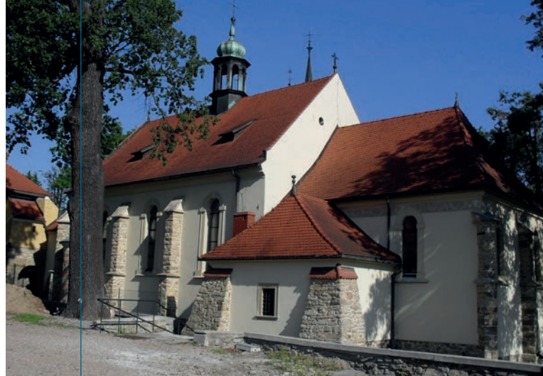
Kościół pod wezwaniem Nawiedzenia Najświętszej Marii Panny (1613-1614).

F undatorem tzw. starego kościoła, klasztoru i kaplic był – podobnie jak renesansowej rozbudowy zamku – Piotr Komorowski, właściciel Suchej w 1. poł. XVII wieku. Kościół, wzniesiony w l. 1613-1614, jest niewielką, orientowaną, jednonawową budowlą murowaną z kamienia łamanego,