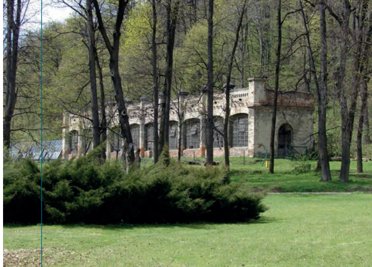
Neogotycka oranżeria w parku zamkowym.

S woistą wizytówką zamku jest jego dziedziniec, któremu suska rezydencja zawdzięcza potoczną nazwę „Małego Wawelu”. Rzeczywiście, jego wygląd nawiązuje stylistycznie do renesansowego dziedzińca krakowskiej siedziby królów polskich. Główną ozdobą dziedzińca są krużganki arkadowe przylegające do parteru i pierwszego piętra południowego i zachodniego skrzydła zamku. Arkady parteru wspierają się na czworościennych filarach, zaś arkady piętra – na delikatniejszych kolumnach toskańskich, ustawionych na wmurowanych w parapety galerii postumentach. Przebieg arkad urozmaicają wysunięte przed lico zasadniczej części krużganków loggie, usytuowane w narożniku między skrzydłami: południowym i zachodnim (o szerokości jednego łuku arkady) oraz w narożniku między skrzydłem zachodnim i wieżą zegarową (o szerokości dwóch łuków arkady). W drugiej z nich postumenty kolumn są uwidocznione na zewnątrz i ozdobione wijącym się ornamentem roślinnym i rombami oraz płasko kutym w kamieniu kartuszem z herbem To-