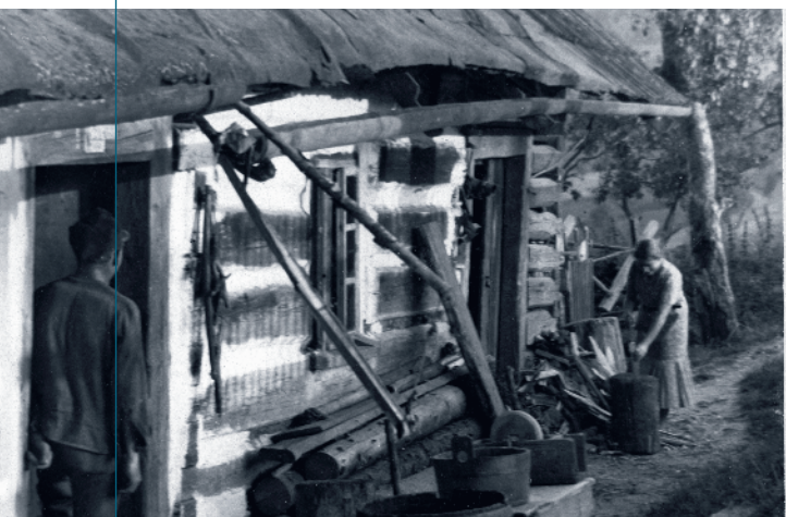
Przed chatą wiejską na Sumerówce, 1939 r.

P omimo licznych i zróżnicowanych obiektów zabytkowych obecnie na terenie Suchej Beskidzkiej dominuje oczywiście architektura współczesna, o cechach funkcjonalnych i użytkowych (blokowe osiedla mieszkaniowe, siedziby urzędów, kompleksy szkolne, centra handlowe, firmowe hale produkcyjne, dominujący nad wsch. częścią miasta kompleks szpitala itp.). Temu tematowi poświęcimy jednak osobne opracowanie.