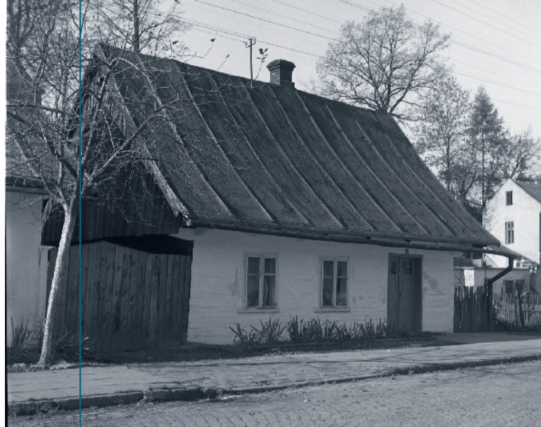
Nieistniejący już dzisiaj dom przy ul. Podgórskiej – obecnie Piłsudskiego.