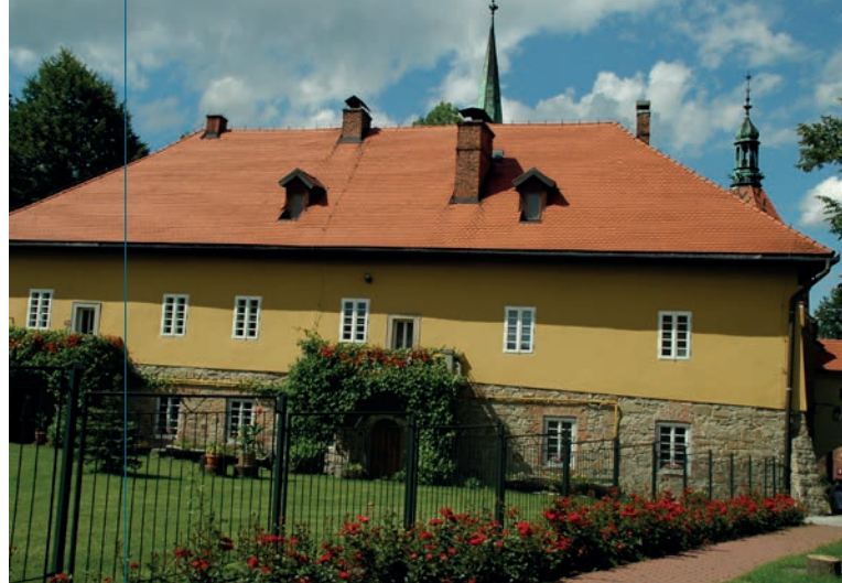
Dawny klasztor kanoników regularnych laterańskich – obecna plebania.