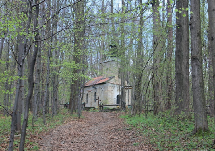
Kaplica konfederacka na górze Jasień.

1772), prawdopodobnie około 1773 roku, wedle tradycji przez samych konfederatów, dla upamiętnienia ich towarzyszy, którzy zginęli w walkach z wojskami rosyjskimi pod dowództwem generała Suworowa, jakie toczyły się w tym rejonie w 1771 roku. Kaplica jest murowana z kamienia łamanego, z wieżyczką, zwieńczoną drewnianą sygnaturką z baniastym hełmem. Obok znajdują się symboliczne mogiły konfederatów. Od momentu powstania miejsce to stało się symbolem wolnej, niepodległej Polski. W okresie PRL przy kapliczce często odprawiano patriotyczne nabożeństwa, także dzisiaj mieszkańcy Suchej licznie gromadzą się tu przy okazji mszy świętych za Ojczyznę, odprawianych w dni świąt narodowych i kościelnych.