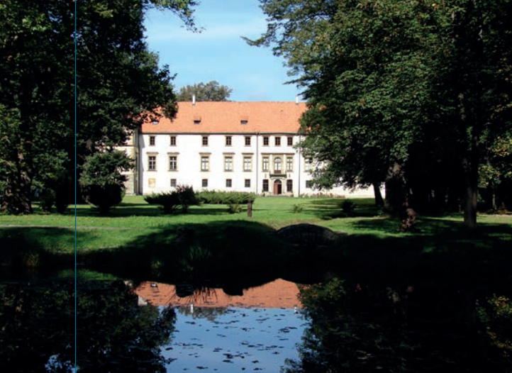
Elewacja południowa zamku. Widok od strony parku.

T rzecie, północne skrzydło zamku, jest – w przeciwieństwie do pozostałych dwóch – parterowe, a nakrywa je dach pulpitowy opadający w stronę północną. Skrzydło północne jest nieco dłuższe od linii dziedzińca i dzieli się na dwie części: zachodnią (przy wieży zegarowej) – krótszą, opatrzoną grubymi murami kamiennymi oraz wschodnią – dłuższą, zbudowaną z cegły. Ze względu na otynkowanie całości, obie części pozostają z zewnątrz jednolite wizualnie. Od strony dziedzińca skrzydło to spinają dwie szkarpy.