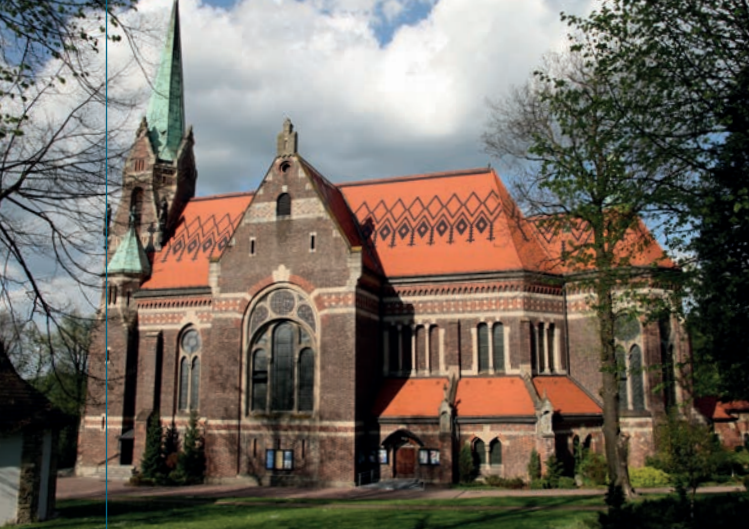
Kościół pod wezwaniem Nawiedzenia Najświętszej Marii Panny, tzw. nowy wg projektu Teodora Talowskiego (XIX/XX w.).