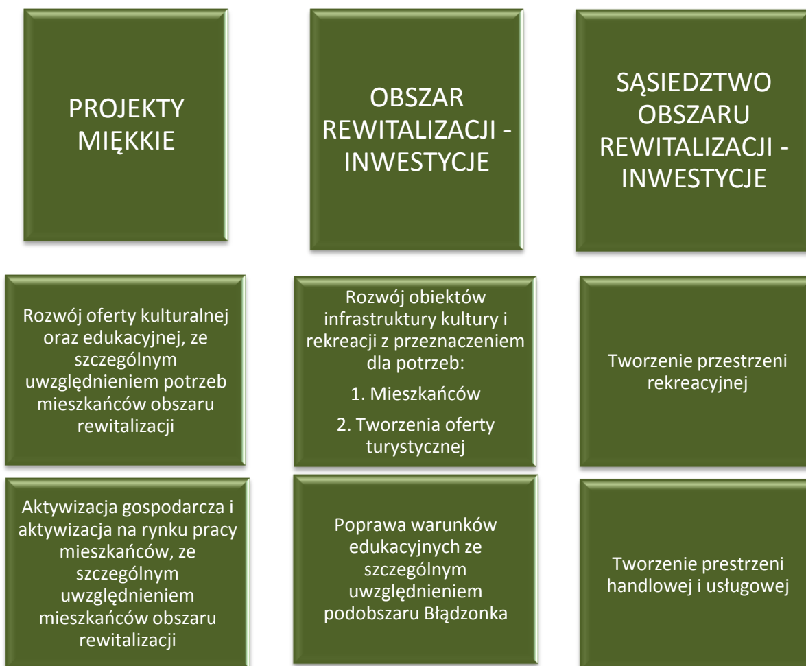
Wykres 1. OGÓLNY MODEL DZIAŁAŃ REWITALIZACYJNYCH

Cel główny: Wyprowadzenie obszaru rewitalizacji Miasta Sucha Beskidzka ze stanu kryzysowego poprzez kompleksową rewitalizację społeczną z wykorzystaniem potencjałów przestrzennych, środowiskowych i infrastrukturalnych.