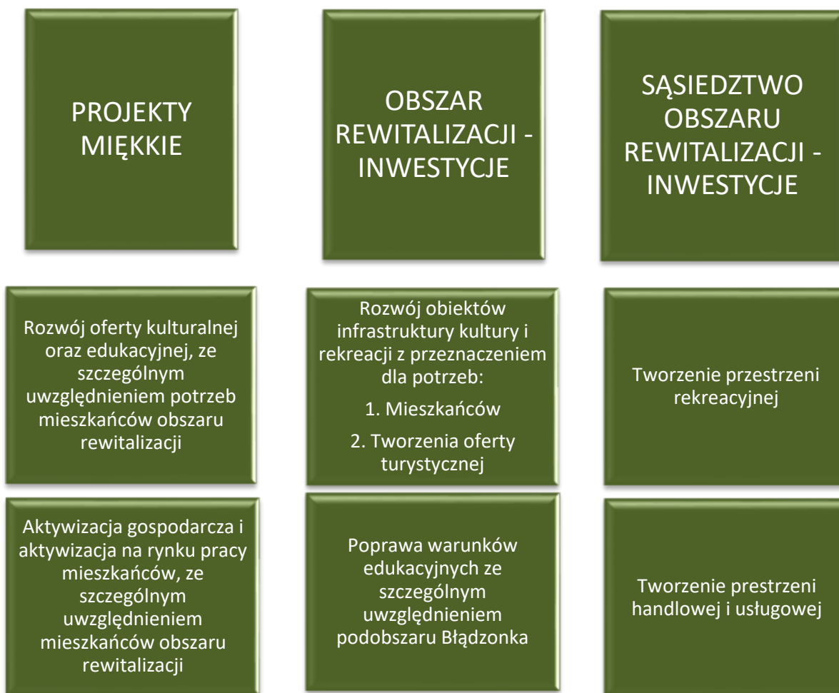
Wykres 1. OGÓLNY MODEL DZIAŁAŃ REWITALIZACYJNYCH

Analiza problemów i potencjałów pozwoliła na określenie wizji rozwoju, stanowiącej punkt docelowy dla rewitalizacji. Wizję przedstawiono dla głównych obszarów problemowych.